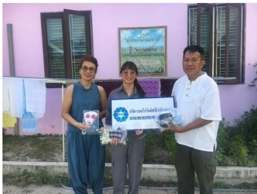
สนับสนุนผลิตภัณฑ์ของชุมชน “หน้ากากผ้าหมักน้ำนมข้าว” จากวิสาหกิจชุมชนคลองน้ำหนู วันที่ 12 พฤษภาคม 2563