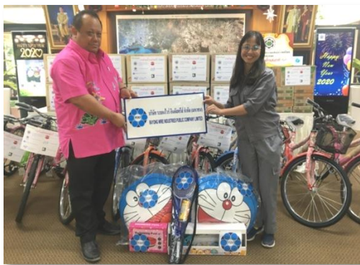
ร่วมสนับสนุนกิจกรรมวันเด็ก ณ การนิคมอุตสาหกรรมมาบตาพุด วันที่ 8 มกราคม 2563

บริษัทปฏิบัติตามกฎหมายที่เกี่ยวข้องกับแรงงานและสวัสดิการ และมุ่งส่งเสริมให้พนักงานมีคุณภาพชีวิตที่ดีด้วยการจัดสวัสดิการสำหรับพนักงานทุกระดับอย่างเหมาะสม สอดคล้องกับลักษณะงานและสถานภาพทางสังคม สนับสนุนส่งเสริม รวมทั้งมีบทบาทในการจัดกิจกรรมต่างๆ ดังนี้