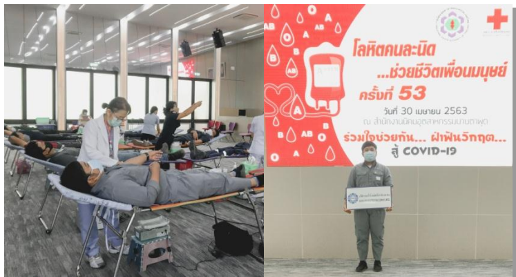
ร่วมกิจกรรมบริจาคโลหิตในโครงการ “โลหิตคนละนิดช่วยชีวิตเพื่อนมนุษย์...” ณ สำนักงานการนิคมมาบตาพุด วันที่ 30 เมษายน 2563